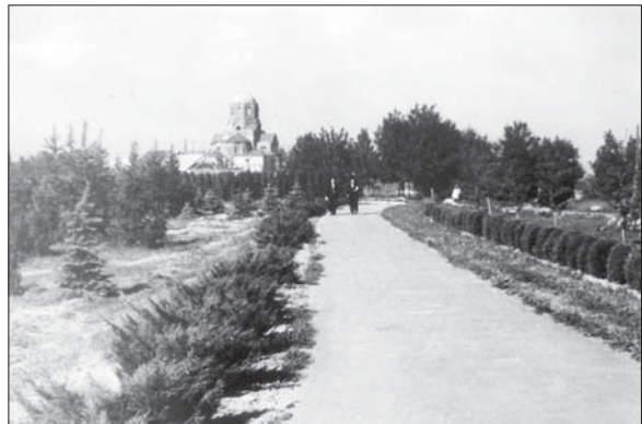
Аллея гинкго.

L.I. Rubtsov near bosquets of Central Republican Botanical Garden of Academy of Sciences of Ukrainian SSR. 1950 years.