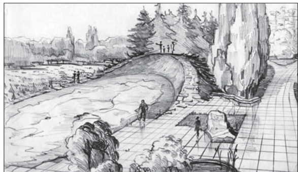
Геоморфологическая модель Подолья. Рис. В.Г. Маевской. Центральный государственный научно-технический архив Украины (Публикуется впервые)

Проект предусматривал, что северная часть сада включала дендрарий, в состав которого