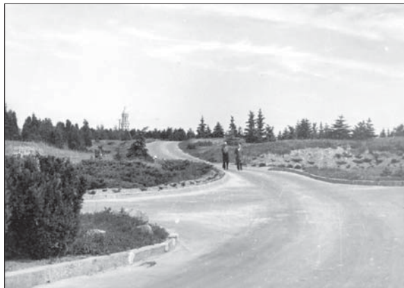
Дендрарий. Фото из архива семьи Рубцовых (публикуется впервые)

Arboretum. Photo from archives of Rubtsov family (first published)