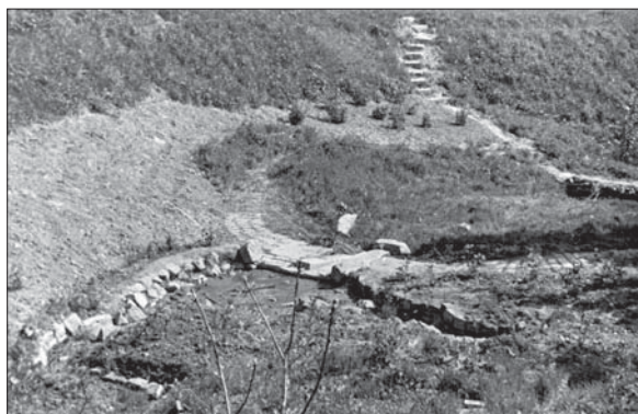
Водоем «Источник чистых наслаждений» во влажной долине. 1957 г.

Arboretum.