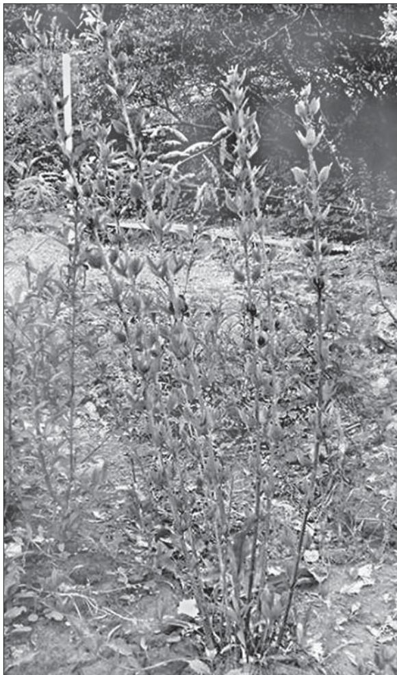
Рис. 3. Чотирирічний сіянець Calycanthus fertilis Fig. 3. Seedling of Calycanthus fertilis of fourth year of life

2—3 відходять з обох боків від середньої жилки. Надсім'ядольне міжвузля від 5—10 мм ( C. occidentalis ) до 10—15 мм ( C. fertilis , C. floridus ) завдовжки, друге міжвузля — 10 мм завдовжки. Листки другої пари більші, видовжено-овальні, подібні до перших. Сім'ядольні листки зберігаються. Гіпокотиль потовщується. З появою справжніх листків починається ріст бічних корінців. Головний корінь заглиблюється в ґрунт до 8 см ( C. occidentalis ) або 9 см ( C. fertilis , C. floridus ).