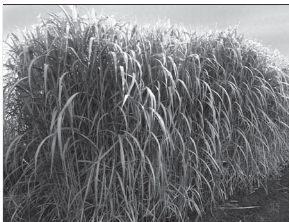
Рис. 3. Miscanthus × giganteus , сорт Гулівер у фазу виходу в трубку