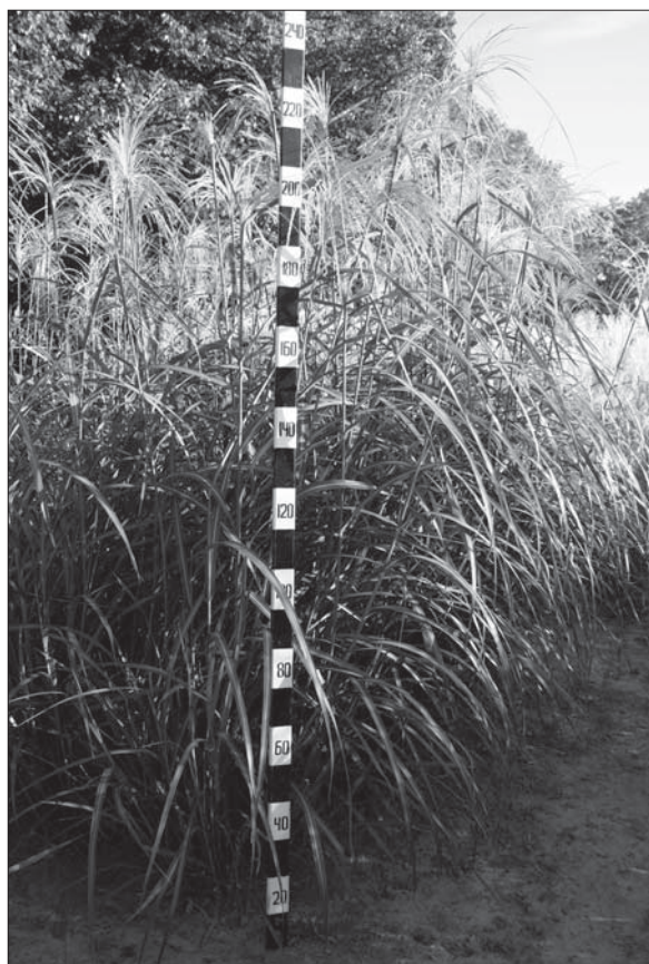
Рис. 4. Miscanthus sinensis , сорт Велетень у фазу цвітіння Figure 4. Miscanthus sinensis , 'Veleten' in the flowering stage

У рослин різних видів Miscanthus через 100–135 діб після початку вегетації настає фаза появи волоті. Це припадає на кінець липня–початок серпня. До фази цвітіння волоть досягає довжини 15–30 см і ширини 6–15 см (рис. 5).