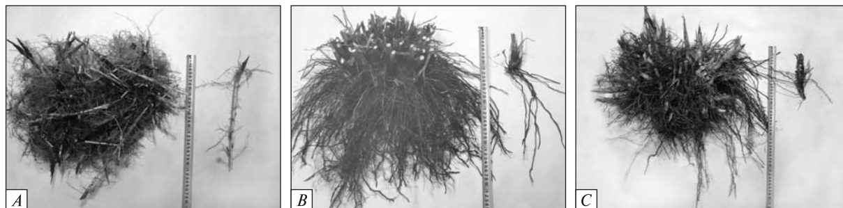
Рис. 8. Кореневище та ризофори рослин Miscanthus : А — M. sacchariflorus ; 'Снігопад'; В — M. sinensis , 'Велетень'; С — M. × giganteus , 'Гулівер'

Для рослин усіх видів та форм Miscanthus характерні великі ростові показники у період