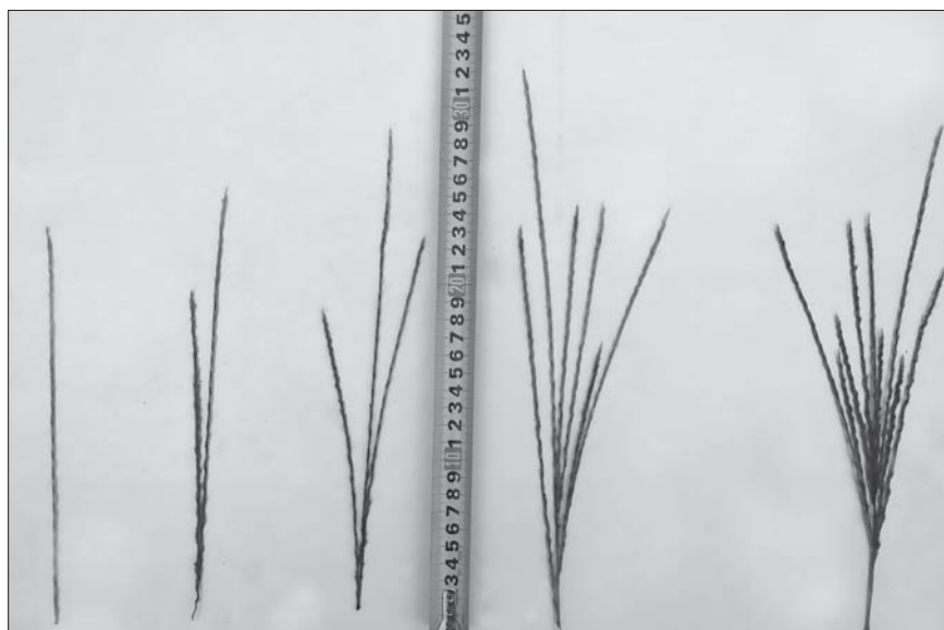
Рис. 7. Гілочки волоті Miscanthus sinensis , 'Велетень' Figure 7. Panicle branches of Miscanthus sinensis 'Veleten'

M. × giganteus мають пухкокущовий тип кущіння (див. рис. 8, С). З огляду на походження цього гібриду не виключається можливість появи форм рослин із кореневищним та щільнокущовим типом кущіння подібно до батьківських форм.