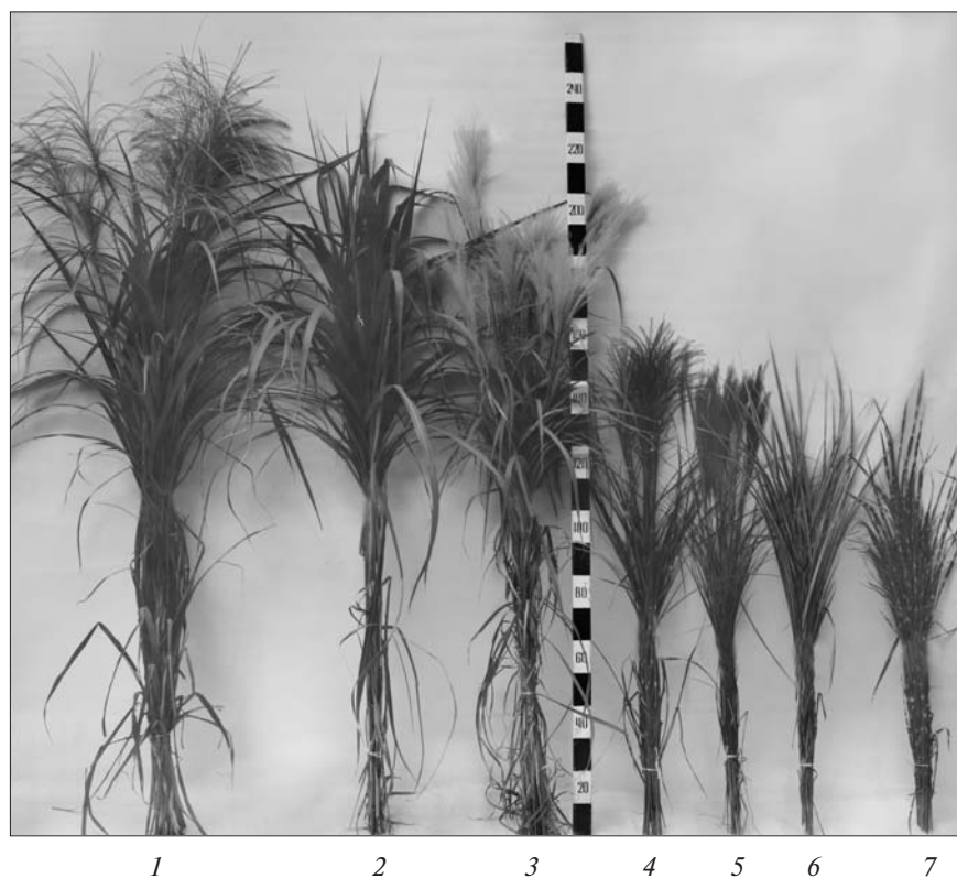
Рис. 1. Видове та формове різноманіття Miscanthus : 1 — M. sinensis ; 2 — M. × giganteus ; 3 — M. sacchariflorus ; 4–7 — форми M. sinensis