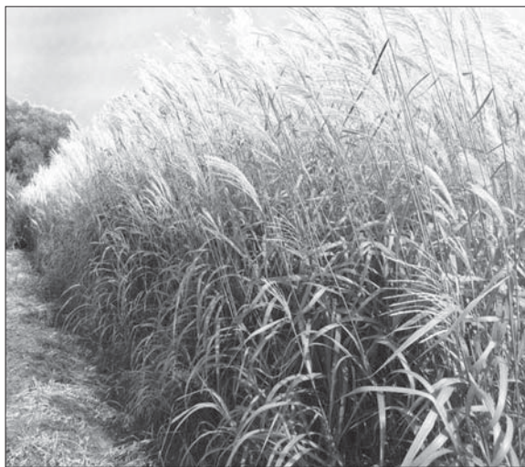
Рис. 2. Miscanthus sacchariflorus , сорт Снігопад у фазу цвітіння

Для рослин M. sinensis характерно найбільше формове різноманіття листків (за розмірами, забарвленням). Трапляються листки світло-зеленого, білого, жовтого, бурого забарвлення з поздовжніми або поперечними смугами та штрихами. Окремі форми рослин мають вузьколанцетну листову пластинку.