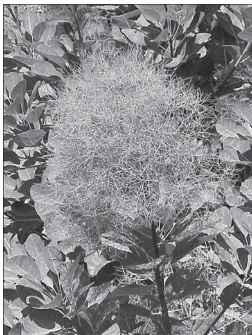
Рис. 1. Суцвіття Cotinus coggygia