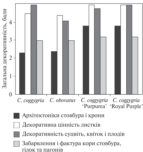
Рис. 3. Загальна декоративність представників роду Cotinus

до жовтня. Для використання декоративних рослин у зеленому будівництві важливе значення має їх загальна декоративність. У нашій роботі дослідження проводили за чотирма ознаками. Результати оцінки загальної декоративності досліджених представників роду Cotinus наведено на рис. 3.