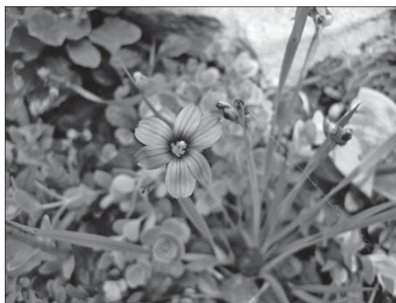
Рис. 2. Молодая генеративная особь Sisyrinchium angustifolium Mill.

На четвертый и в последующие годы после посева растения имеют все признаки зрелых генеративных особей, ежегодно