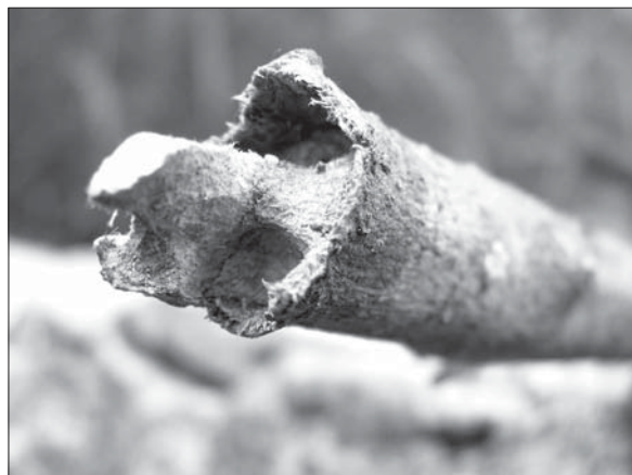
Рис. 1. Пошкоджений Zeuzera purina стовбур Syringa vulgaris