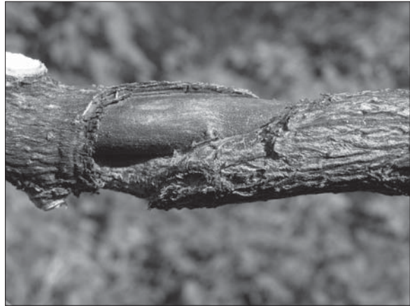
Рис. 3. Пошкоджена Vespa crabro кора гілки Syringa vulgaris

Vespa crabro (шершень) об'їдає кору навколо або вздовж осі 2—4(5)-річних гілок. Найчастіше смужка пошкодження 1—3 см завширшки, 3—8 см завдовжки і 2—3 мм завглибшки, тобто досягає деревини (рис. 3). Її контур досить нерівний: може стрімко здійматися вгору або спрямовуватись у будь-який бік. Найвідчутнішої шкоди ці комахи завдають у другій половині літа, коли їхня чисельність різко зростає. Останнє, як відомо, зумовлене тим, що до весни доживають лише запліднені самки (матки). В травні вони виходять зі схованок і розпочинають швидко створювати сім'ю. В результаті до кінця літа шершні-робітники будують гніздо, яке може містити до 400 чарунок і більше, а його висота може сягати 60 см. Саме для спорудження чарунок вони використовують кору деяких деревних рослин, наприклад, Cerasus vulgaris Mill., C. avium (L.) Moench, Fraxinus excelsior L. і, як свідчать наші спостереження, S. vulgaris . Ми виявили, що швидкість обгризання кори прямо пропорційно залежить від міри насичення її вологою, тобто що вона вологіша, то продуктивніше «працюють» шершні. Повністю об'їдена по кільцю гілка приречена на всихання, яке виявляється