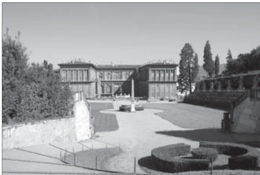
Рис. 2. Палац Пітті та амфітеатр Садів Боболі

цепції парку. Ніколо Тріболо взяв за основу схеми саду вісь перспективи, що пересікає вхід у палац Пітті і піднімається вздовж пагорба, розташованого за ним. Власне на цій композиційній осі і були сплановані тераси, парадні сходи, грати і басейни, в яких плавали декоративні рибки і були розташовані скульптури. Тоді ж на місці старої каменоломні був створений "амфітеатр", спочатку оформлений по периметру вічнозеленими рослинами, прикрашений римськими статуями персонажів стародавніх міфів і легенд. У ті часи парк прикрашали скульптура Джамболоньї "Фонтан Океану", яка потім була перевезена в інше місце, малий "Грот Мадам" і "Великий грот", розпочатий Вазарі і завершений Амманнаті і Буонталенті впродовж 1583 та 1593 рр.