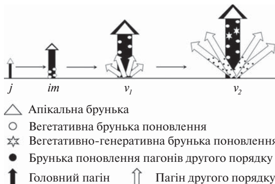
Рис. 2. Схема формування системи пагонів рослин видів роду Heuchera впродовж першого року вегетації

Вегетативні бруньки та бруньки змішаного типу формуються акропетально у пазухах асимілюючих листків. Упродовж вегетаційного періоду у них відбуваються ростові процеси. В кінці першого вегетаційного періоду у рослин досліджених видів роду Heuchera бруньки поновлення перебувають на різних етапах сформованості, про що свідчить кількість елементів пагона в закритій бруньці. Лінійні розміри бруньок у кінці першого року вегетації варіюють від ( 3,4 \pm 0,4 ) до ( 6,0 \pm 0,3 ) мм у довжину та від ( 1,6 \pm 0,3 ) до ( 4,1 \pm 0,3 ) мм у ширину.