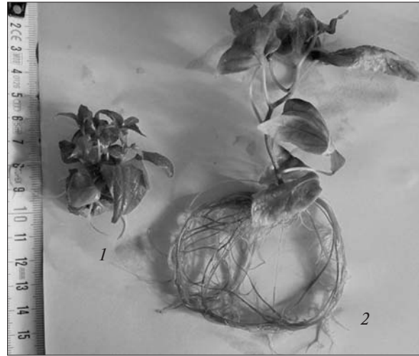
Рис. 4. Рослини Actinidia arguta in vitro на живильних середовищах з різним вмістом гормонів, сорт Оригінальна, 30-та доба асептичного культивування: 1 — БАП (1,5 мг/л); 2 — ІМК (2 мг/л)

Окрім додавання ауксину, ризогенез стимулювався зменшенням вмісту мінеральної частини у складі живильних середовищ (табл. 4). Із варіантів живильних середовищ оптимальним виявився QL 1/2 (середовище за Куаріном і Лепувром із зменшеною вдвічі мінеральною частиною). В усіх об'єктів у цьому варіанті формувалася найдовша коренева система. Наприклад, у сорту Hayward на 30-ту добу культивування довжина кореневої системи становила 50 мм проти 12 мм на MS. Регенеранти, вирощені на модифікованому середовищі (МК і МК 1/2 ), поступалися за довжиною кореневої системи лише варіантам QL і QL 1/2 відповідно. Проте варіант МК відрізнявся кращим розвитком листкової пластинки. Візуально листкові пластинки були товщими та