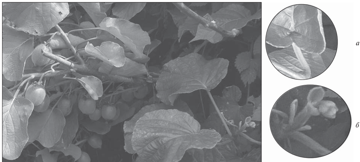
Рис. 1. Типи експлантів за місцем ізоляції з донорної рослини (жіноча форма № 1 Actinidia chinensis ), 25.07.2016 : a — медіальний; b — апікальний