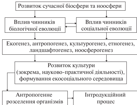
Рис. 1. Виникнення інтродукційного процесу в еволюції сучасної біосфери

В умовах трансформації людиною довкілля, екологічної та соціальної кризи, яка посилюється, для забезпечення успішного проходження інтродукційного процесу важливо насамперед визначити вплив на екосоціальне середовище рослин, як вже випробовуваних або відносно нещодавно залучених у госпо-