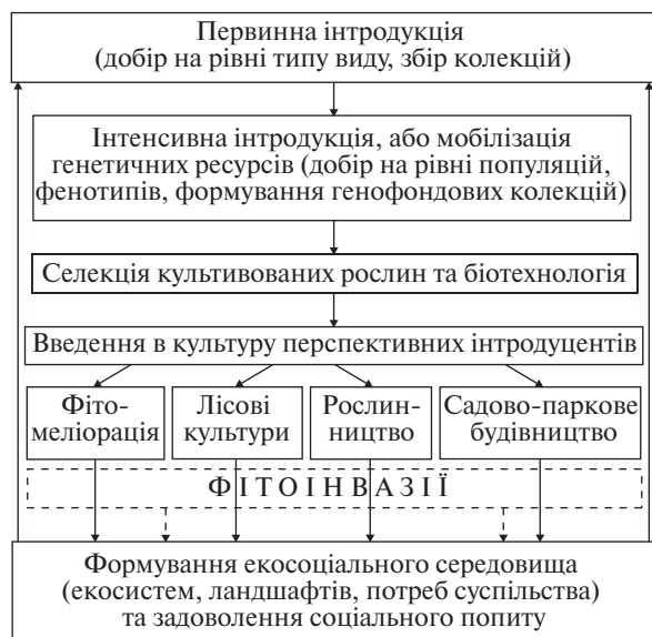
Рис. 2. Взаємодія інтродукції рослин та екосоціального середовища