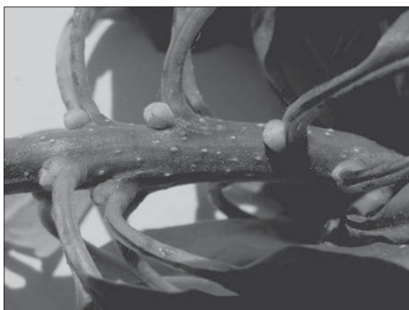
Рис. 4. Фрагмент фасційованого пагона з безсистемним розташуванням листків з брунькою в їх пазусі