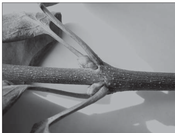
Рис. 2. Фасційований пагін Syringa vulgaris з чотирма бруньками у вузлі