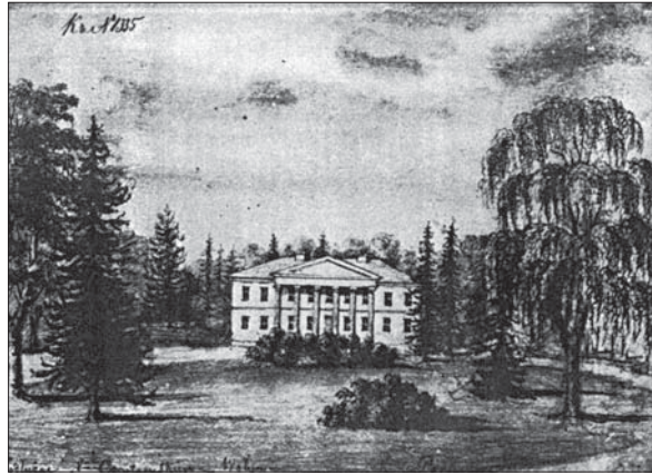
Рис. 2. Палацово-парковий ансамбль у маєтку князя М. Радзивілла в с. Підлужне. З акварелі Наполеона Орди (1872)

До переліку оранжерейних рослин потрапили види, які на Волинському Поліссі можуть зростати у відкритому ґрунті, зокрема Achillea ptarmica та Gypsophila paniculata , природні ареали яких охоплюють Волинське Полісся, і Veronica multifida , котра є видом природної флори України. Вони фігурують лише