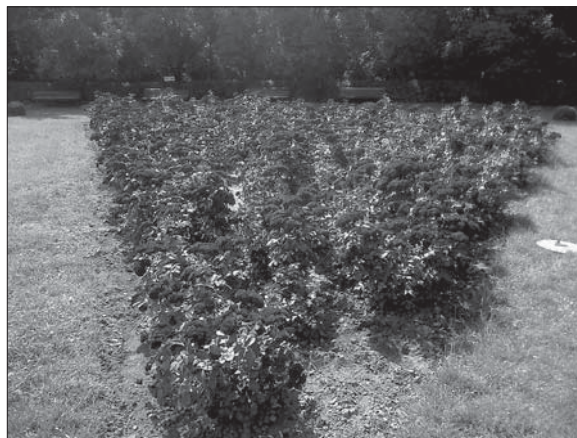
Рис. 2. Ділянка досліду з внесеною сумішшю (08.2013, НБС).

З огляду на позитивні результати досліджень попередніх років, сильну уражуваність троянд у центральній частині Ботанічного саду, на експериментальних ділянках партеру в 2015 р. було повторно внесено кремнієвмісну суміш, але лише в дозі 50 г/м 2 . Погодні умови цього року не сприяли ураженню троянд збудником борошнистої роси. З настанням прохолодних ночей і похмурних вологих днів почали з'являтися перші ознаки ураження рослин збудником на пелюстках квіток, які відцвітали. На момент обстеження (30 вересня) були уражені деякі листки молодого приросту, але ураження були незначні (0,1—1,0 бал), що не псувало естетичний вигляд ділянки. Приріст рослин на момент обстеження становив у середньому 31,6 см (табл. 2). Інтенсивність поширення хвороби — 21,2 %, при розвитку в середньому 1,8 %.