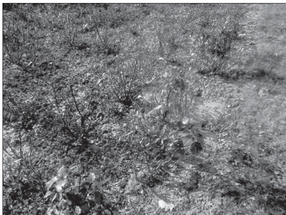
Рис. 1. Ділянка контролю без внесення кремнієвмісної суміші (08.2013, НБС).

Fig. 1. The area of control without silicon-containing mixture (08.2013, NBG).