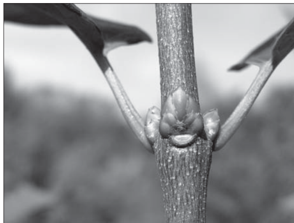
Рис. 1. Фасційований пагін Syringa vulgaris з трьома бруньками у вузлі

До конусів наростання, розташованих ближче до кореневої системи, органічних речовин первинного метаболізму надходить значно більше. Відповідно вони (конуси наростання) стають ще об'ємнішими. За морфологічною будовою частина фасційованих пагонів, сформованих такими апексами, відрізняються від звичайних лише тим, що в їх вузлах закладено не по два листки, що нормально для бузків, а по три (рис. 1) або за значно активніших органогенних процесів — по чотири листки з брунькою в кожній пазусі (рис. 2). Вісь таких пагонів при відкритому рості значно потовщена, але в поперечному розрізі — майже округла (І група фасційованих пагонів). Ні анатомічно, ні морфологічно вона нічим не вирізняється серед звичайних, а тому в перспективі стає повноцінною гілкою. Такі пагони мають лише один недолік: з них не можна нарізати