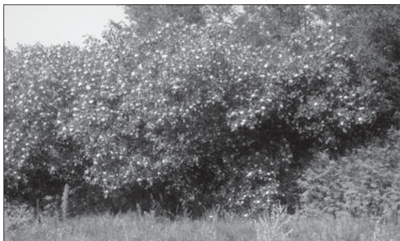
Рис. 3. Зарості Ptelea trifoliata та Sorbaria sorbifolia — все, що залишилося від міклерівського парку в с. Підлужне