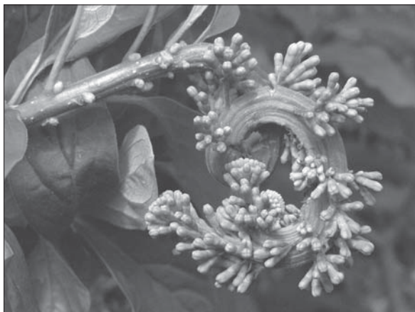
Рис. 3. Циліндрична вісь фасційованого пагона Syringa josikaea з безсистемним розташуванням на ній бруньок та з раптовим переходом її до сплющеної форми