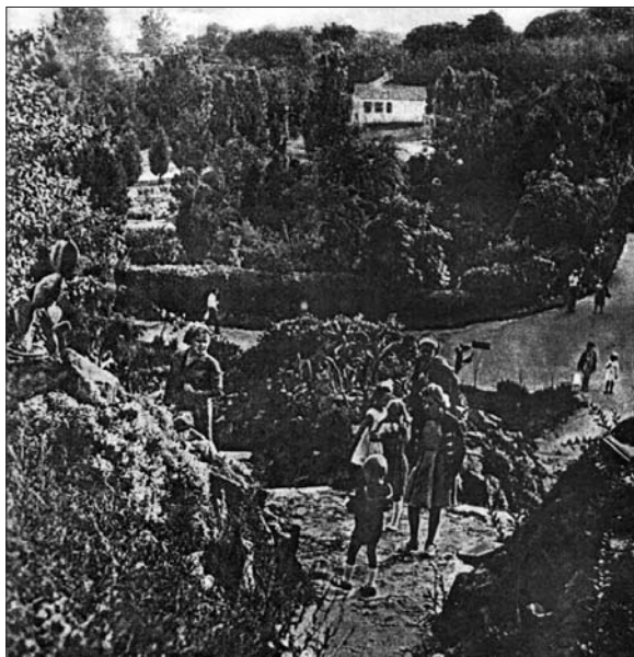
Рис. 2. Фрагмент "Гірки декоративних сукулентів", 1960 р.

кліматичних умовах добре переносять зими. Однак обмежена кількість видів тропічних сукулентів, які можуть рости в метеорологічних умовах м. Києва, і невелика площа ділянки не давали змоги відтворити ландшафт Мексики, Аргентини або Північної Африки. Проте окремі характерні ділянки і мікропейзажі в поєднанні з мікрорельєфом створювали враження природних пустель.